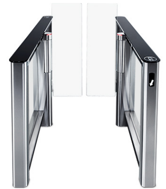
Standardschwenktüren | 650 mm

In Notsituationen, wie z.B. bei Stromausfall, empfängt das Speed Gate ein Notsignal. Es schaltet sich unmittelbar danach ab und ermöglicht den Passanten durch ein leichtes nach Hintendrücken einen schnellen Durchgang.