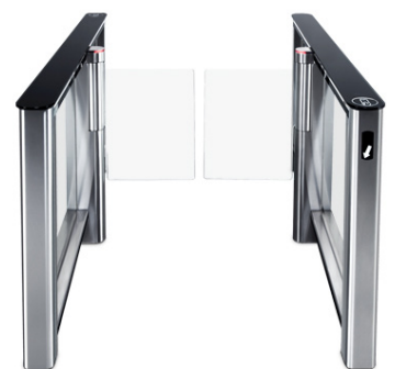
Erweiterte Schwenktüren | 900 mm